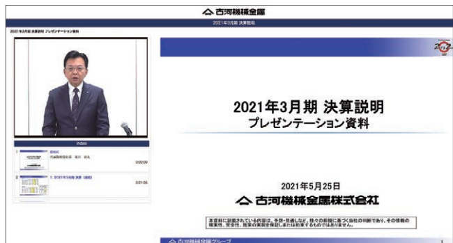
決算説明動画を2020年度より配信