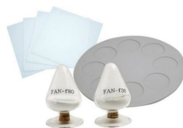
窒化アルミセラミックス

※ ファインセラミックス：純度、組成、製造工程を精密に制御して製造される特殊な特性を持つ陶磁器。