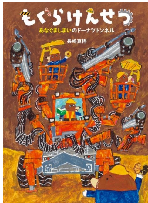
第3作目『あなぐましまいのドーナツトンネル』