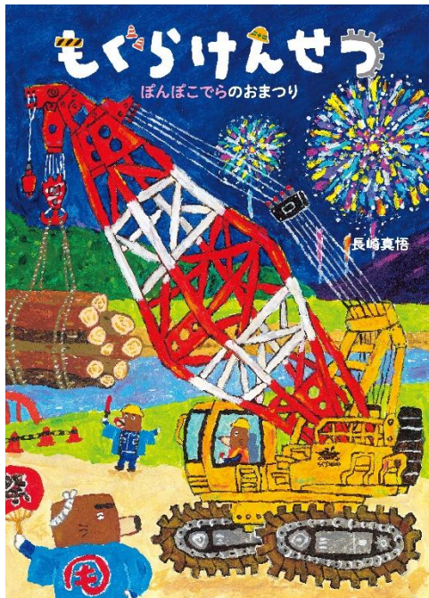
第2作目『ぼんぼこでらのおまつり』