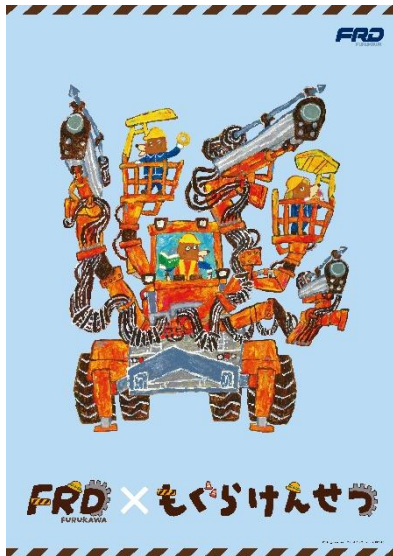
「もぐらけんせつ」シリーズとのコラボポスター