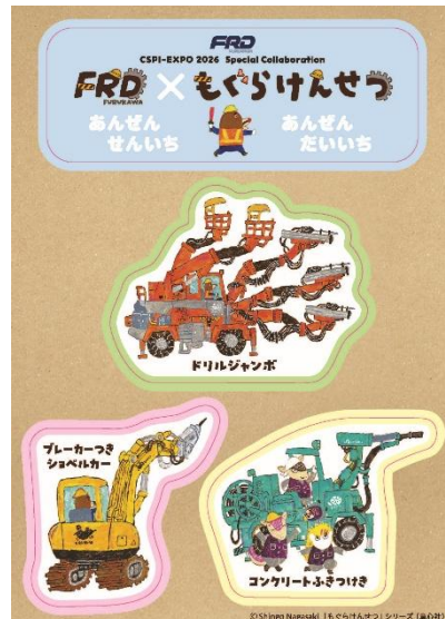
「もぐらけんせつ」シリーズとのコラボシール