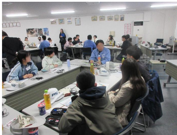
技術者との対話セッション