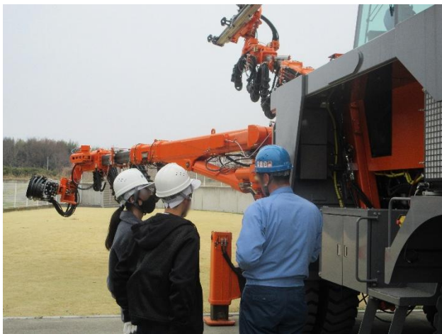
実機を間近で見学