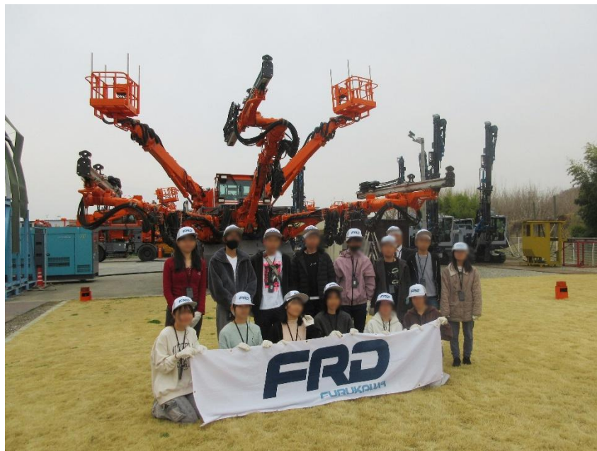
トンネルドリルジャンボの実機を前に記念撮影

当社グループでは、学生のキャリア教育支援を目的として、業界および職業研究や、将来のキャリア形成の一助となる機会の提供に、引き続き取り組んでいきます。