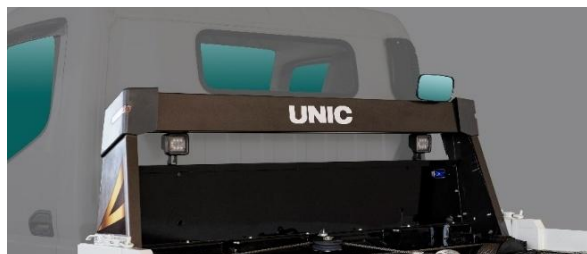
低型鳥居（写真は UC02E。オプションの開閉式横アオリ装着機）

スタイリッシュな外観を有しながら、機能はそのまま。荷台傾斜作業時も車両上方に大きく突出することがありません。