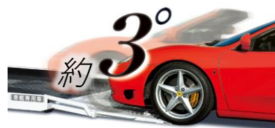
約 3°の乗り込み角度