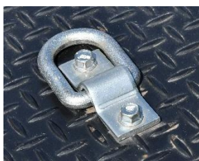
丸環フック（ボルト締結式）

新たに、丸環フック、埋め込みフックのフック本体取り付け方法をボルト締結式として、破損時の交換を容易にしました。また、作業灯、クラッチランプを LED 化して長寿命と省電力化に努めました。