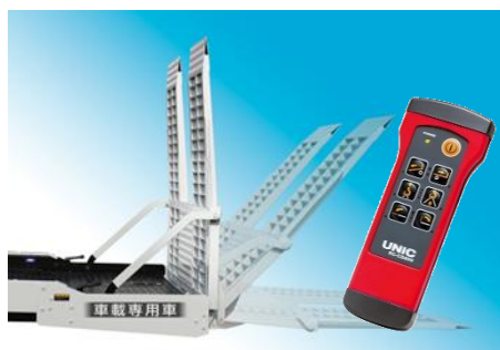
全自動油圧開閉式リヤゲート（Neo 5 のみ）