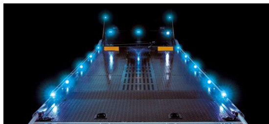
荷台内 LED マーカーランプ（写真はクラッチランプの光を含みます）

夜間飛行からのランディングを思わせるような 2 ラインのブルー LED（14 ヶ）で、夜間積載時の車幅視認性をアップします。