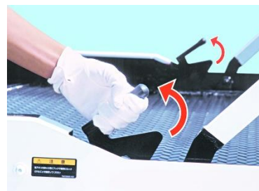
片側解除・自動ロック機構（Neo 5 のみ）