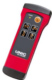
特定小電カラジコン

『Neo 5』のリヤゲートは片手で荷台両側のロックを解除、また、格納時はリヤゲートを起こすだけで自動ロック（リヤゲート固定）する機構を採用しました。荷台の左右に移動してリヤゲートのロック解除や固定をする煩わしさがありません。