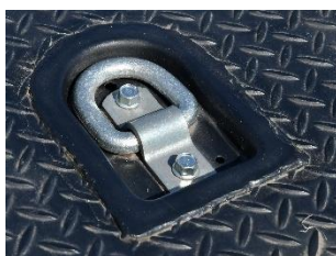
埋め込みフック（ボルト締結式） （※受け皿部は溶接タイプ）