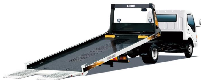
ユニックキャリア『Neo EX』 UC-28EG