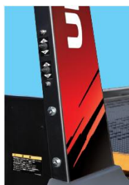
鳥居側面操作スイッチ（助手席側）