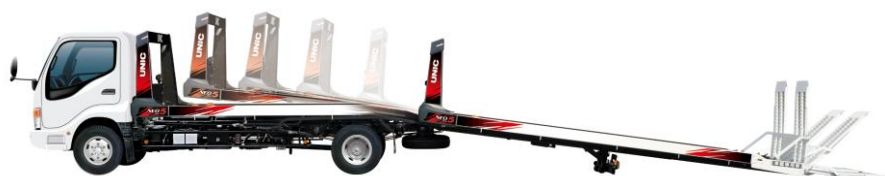
荷台傾斜角度 5°クラスのベストアングル・スロープ