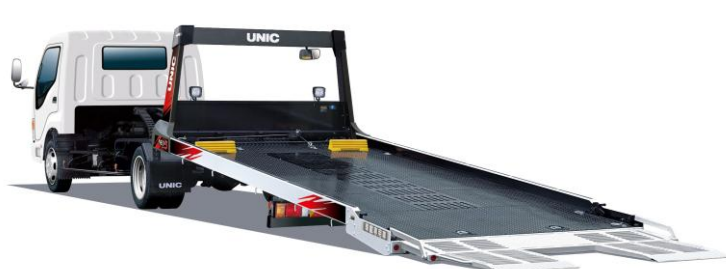
ユニックキャリア『Neo 5』 UC-35EG

古河ユニックは、車両運搬車のブランド「ユニックキャリア」を通じて、今後も、お客さまのニーズに応える商品の開発・提供を行っていきます。