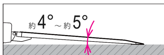
一般的なフラット型キャリアのストレート・リヤゲート乗り込み角度