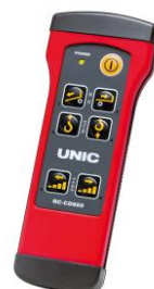
アイドルアップ機能付きラジコン

ラジコン操作機にアイドルアップ機能を追加することで手元で荷台スライドやウインチのスピードを 4 段階に調整することが出来ます。