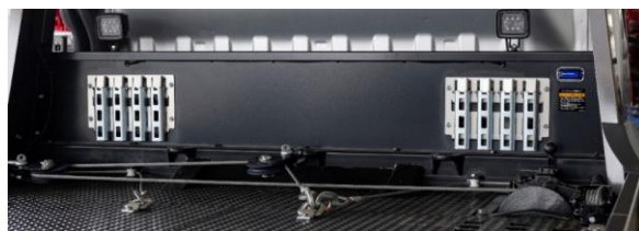
タイヤラッシング収納スペース

鳥居腰板部にタイヤラッシング装置のブラケット収納スペースを設けました。煩雑になりがちな小物管理が容易に行えます。