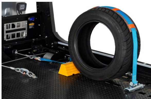
タイヤラッシング装置

取り付けブラケットの採用により、積載車両のトレッドに合わせたより細かな固定位置調整が可能になりました。また、ベルトの着脱も、ベルト側の金具をブラケットに挿入して 90°回転させるだけの簡単操作。ステンレス製ブラケットは無塗装で暗所でも目立ち、作業が捗ります。