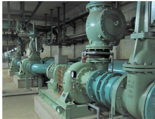
ポンプ設備イメージ