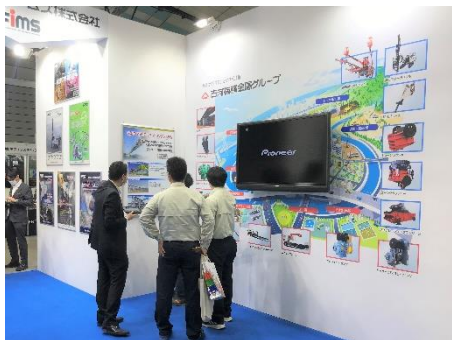
古河産機システムズ