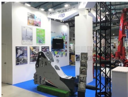
古河ロックドリル